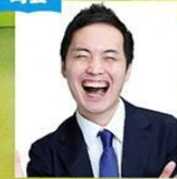
カモシダせぶん (松竹芸能)