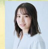
くわがた心 (松竹芸能)