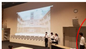
市生徒会フォーラムで本校 の取組を堂々と発表